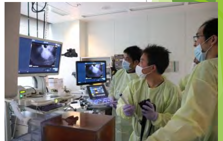
ハンズオンセミナー時の様子