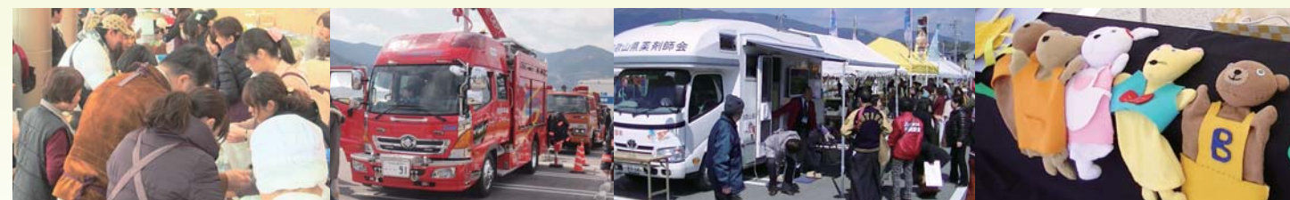
紀北分院健康フェスタ実行委員会及び紀北分院職員一同

多くの方々のご協力のもと、「紀北分院健康フェスタ」を大盛況の内に終わることができました。ご来場いただいた地域の方々、協賛いただいた各団体、また運営にお手伝いいただいた方々どうもありがとうございました。