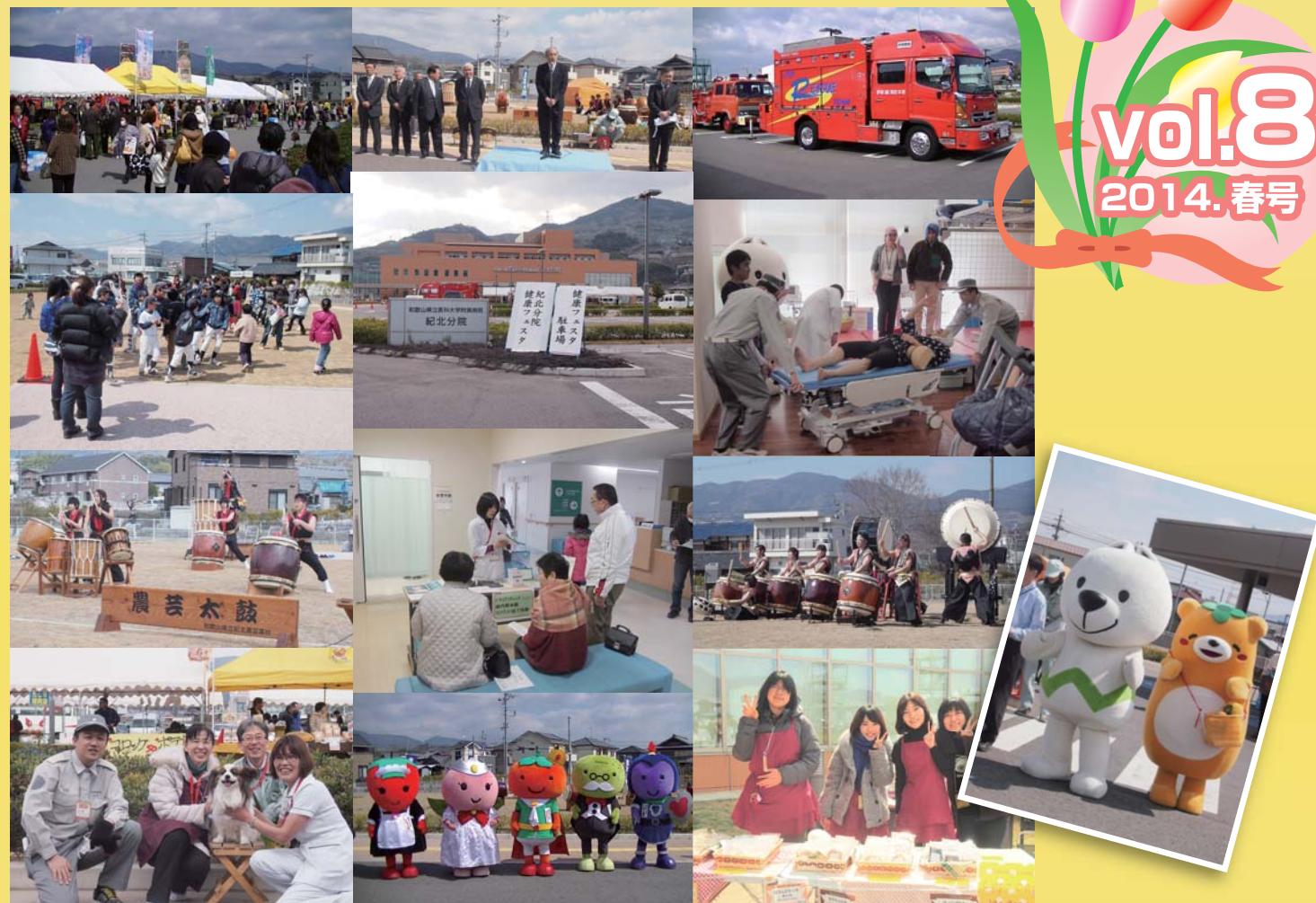
紀北分院健康フェスタ